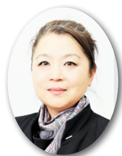
電通健康保険組合